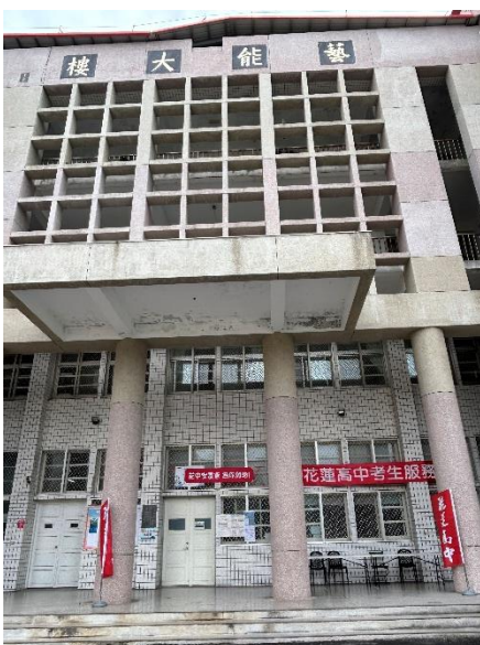
藝能大樓一樓即是考生服務區。 祝福大家考試順利~