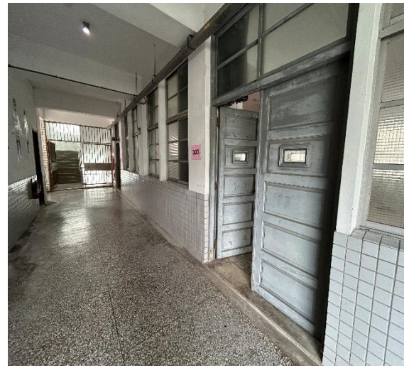
301、302、303 休息區在藝能大樓 2 樓的桌球室。